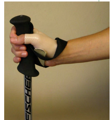
Órtesis personalizada para proteger la lesión del ligamento colateral cubital del pulgar

El terapeuta puede fabricar una órtesis personalizada para permitir que el ligamento del pulgar descanse mientras sana. Mientras el ligamento esté cicatrizando, el terapeuta proporciona ejercicios suaves para las otras articulaciones de la mano. Después de que el ligamento haya cicatrizado, el terapeuta avanzará con ejercicios para aumentar la función y la fuerza en la mano y el pulgar.