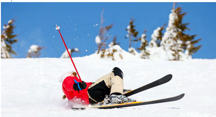
Sujeter un bastón de esquí durante una caída puede causar la lesión del pulgar del esquiador

Con mayor frecuencia, las lesiones ocurren durante actividades deportivas o recreativas, como el esquí, el fútbol americano, el ciclismo y el fútbol. Cualquier fuerza extrema aplicada al pulgar en la dirección opuesta puede causar un esguince o una distensión, pero las lesiones también pueden producirse como resultado de una caída o de un golpe en el pulgar.