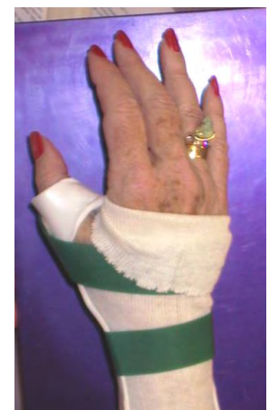
Ejemplo de una órtesis para inmovilizar la muñeca en una lesión del ligamento escafolunar

El terapeuta de mano puede fabricar una órtesis personalizada para inmovilizar la muñeca. La recuperación del movimiento y la fuerza de la muñeca será el enfoque principal del tratamiento. El terapeuta de la mano y el cirujano trabajarán juntos para lograr el mejor resultado posible.