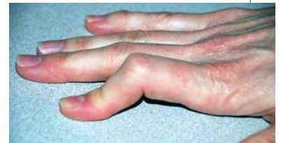
Deformidad en boutonnière del dedo índice que muestra la articulación IFP doblada y la articulación IFD recta

El tratamiento de una deformidad en boutonnière comienza con un diagnóstico preciso realizado por un médico. En el caso de una lesión reciente que no requiera cirugía, el tratamiento implica la derivación a un terapeuta de mano. Las deformidades en boutonnière que son el resultado de una lesión no tratada, artritis o una laceración la bandeleta central del tendón extensor pueden requerir cirugía.