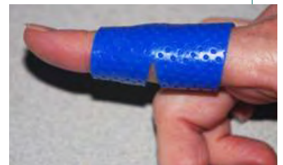
Ejemplo de una órtesis personalizada para el dedo en una deformidad en boutonnière