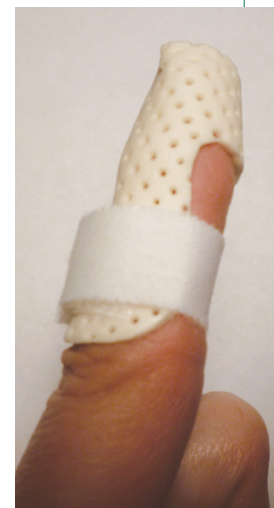
Ejemplo de un ortesis para el dedo en martillo