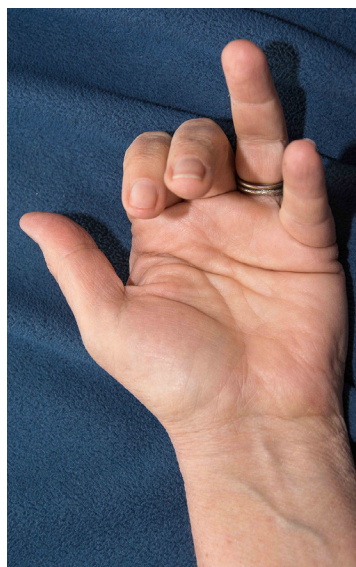
Ejemplo de un tendón flexor lesionado en el dedo anular en el cual el dedo se mantiene extendido en lugar de doblado

El terapeuta de mano es una parte importante de la atención postquirúrgica. Después de la cirugía, el terapeuta de mano fabricará una férula hecha a medida y comenzará un programa de ejercicios protegidos. Los objetivos de la terapia son proporcionar un movimiento suave al tendón que está cicatrizando para evitar la formación de adherencias y para prevenir la separación del tendón reparado. El médico, el terapeuta de mano y el paciente trabajan juntos como un equipo para lograr los mejores resultados posibles después de una lesión del tendón flexor.