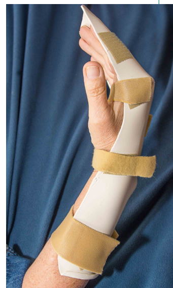
Ejemplo de una férula de tendón flexor para proteger el dedo lesionado