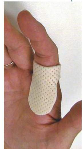
Ortesis para dedo en gatillo

El médico puede enviar al paciente al terapeuta de mano para tratamiento no quirúrgico y en caso de cirugía, para el posoperatorio. En el caso del tratamiento no quirúrgico, el terapeuta de mano certificado tiene un entrenamiento especializado para fabricar una férula hecha a la medida para que el dedo esté en reposo y también le enseña los ejercicios para prevenir la rigidez durante el proceso de cicatrización. El terapeuta de mano certificado mencionará formas de modificar las actividades a medida que el dedo se mejora. La terapia de mano después de la cirugía mejorará el rango de movimiento y le enseñará al paciente cómo recuperar nuevamente la función de la mano.