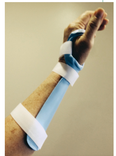
Ortesis para el codo de tenista para ayudar a descansar al área afectada

El terapeuta de mano puede ofrecer manejo conservador para el tratamiento del codo de tenista, con el objetivo de devolver al paciente a sus actividades diarias del trabajo, del hogar, y de los deportes. El terapeuta puede ayudar a identificar cuáles actividades podrían agravar los síntomas y discutir las modificaciones de dichas actividades. Se puede recomendar una férula para la muñeca, o una ortesis fabricada a la medida para descansar el área. Se pueden utilizar varios tratamientos, como calor, hielo, ultrasonido, masaje o estimulación eléctrica. El terapeuta a menudo indicará ejercicios de estiramiento y fortalecimiento. Después de cualquier cirugía para el codo de tenista, la terapia es importante para recuperar el movimiento y la fuerza.