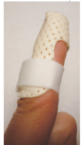
Ejemplo de un ortesis para el dedo en martillo