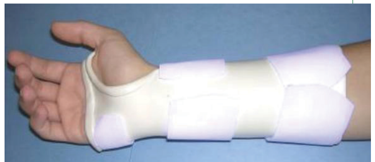
Un ejemplo de un órtesis para el síndrome del túnel carpiano

Un terapeuta de mano puede ayudar a reducir los síntomas de STC, realizando primero una evaluación completa para determinar la causa principal del problema. Él o ella podría recomendar el uso de una muñequera por la noche para mantener la muñeca en una posición segura o durante el día para actividades que irritan el nervio. Un terapeuta de mano puede proporcionar educación al paciente y hacer recomendaciones para reducir los síntomas durante las actividades de la vida diaria, el trabajo y las actividades recreativas. Un terapeuta de mano también puede prescribir ejercicios específicos para ayudar en la recuperación o prevención de ocurrencias futuras de STC.