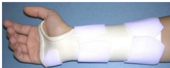
Un ejemplo de un órtesis para el síndrome del túnel carpiano

Un terapeuta de mano puede ayudar a reducir los síntomas de STC, realizando primero una evaluación completa para determinar la causa principal del problema. Él or ella podría recomendar el uso de una muñequera por la noche para mantener la muñeca en una posición segura o durante el día para actividades que irritan el nervio. Un terapeuta de mano puede proporcionar educación al paciente y hacer recomendaciones para reducir los síntomas durante las actividades de la vida diaria, el trabajo y las actividades recreativas. Un terapeuta de mano también puede prescribir ejercicios específicos para ayudar en la recuperación o prevención de ocurrencias futuras de STC.